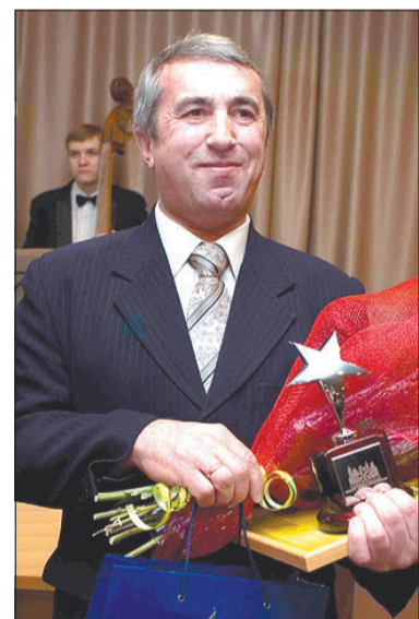
Вовремя платить выгодно!

глупые. Поскольку мой посёлок живёт без долгов, к нему и отношение соответствующее. В прошлом году мне 10 домов откапиталили, да в позапрошлом ещё три. Вот и получается, что половина многоэтажного жилого фонда у меня отремонтирована. В 2010 году хочу откапиталировать ещё 10 домов. И будет 100%-й ремонт. Вовремя платить выгодно!